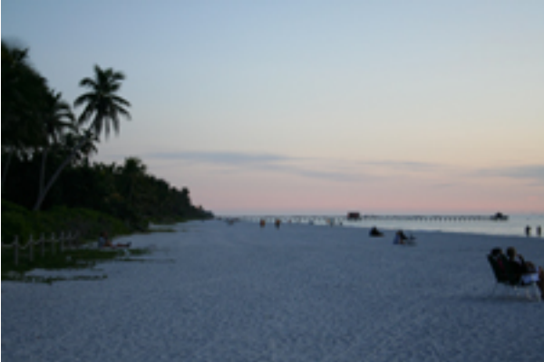
der Strand am Abend Naples - America's Best All-Around Beach

Naples ist ein bezauberndes Städtchen an Floridas südwestlicher Golfküste, fast schon mondän mit eleganter Atmosphäre. Breite, mit Läden, Kunstgalerien und Restaurants gesäumte Gehwege sowie zahlreiche palastartige Villen inmitten von tropischen Gartenanlagen laden den Besucher zum Bummeln und Schwelgen ein. Die schneeweißen Sandstrände, zahlreiche Golfplätze, vielfältige Wassersportmöglichkeiten und nicht zu vergessen die traumhaften Sonnenuntergänge haben die Gegend bekannt gemacht. In der Nebensaison von Mai bis Dezember lässt sich der Charme und das elegante Ambiente des Küstenstädtchen zudem zu deutlich niedrigeren Hotelpreisen genießen. Auch bei Familien und jungen Pärchen wird Naples immer beliebter. Das Image als Rentnerrefugium hat Naples mittlerweile auch durch seine lebendigen Cafészene in der Innenstadt und den vielen Angeboten für Outdoorfans komplett abgestreift und das Publikum ist nunmehr durch alle Altersstufen bunt gemischt.