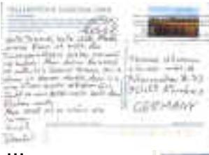
dem Yosemite N.P.